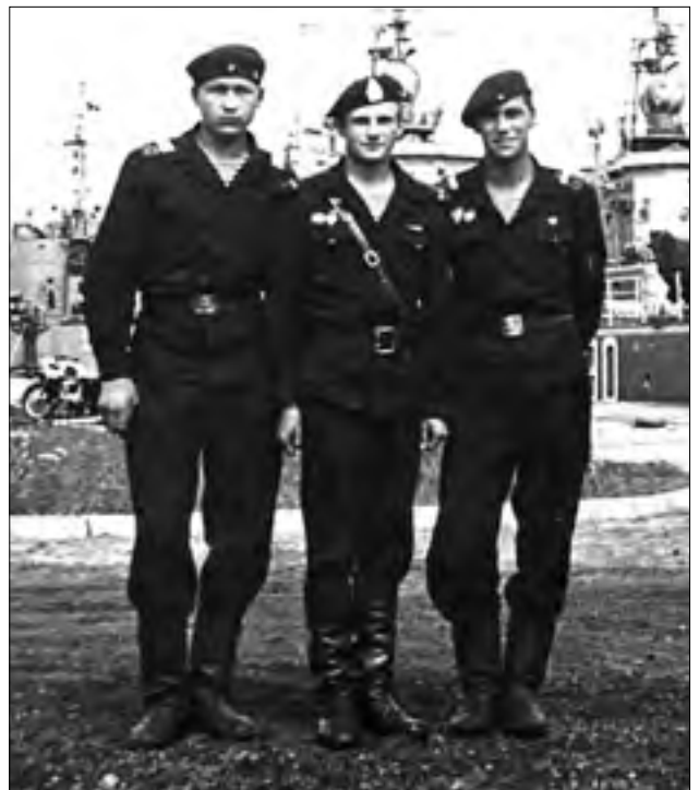
На учениях «Север-68»