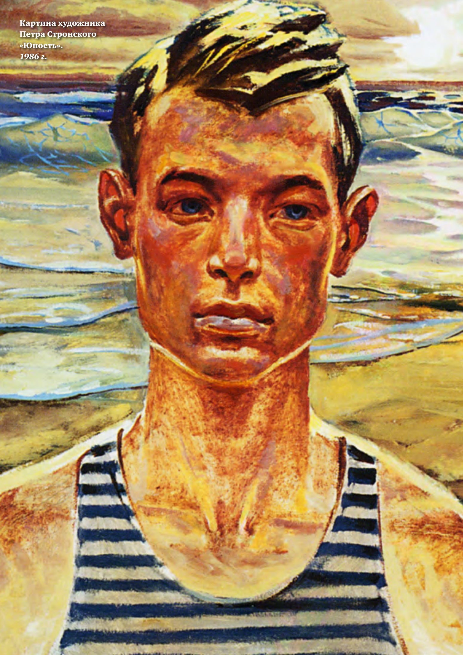
Картина художника Петра Стронского «Юность». 1986 г.