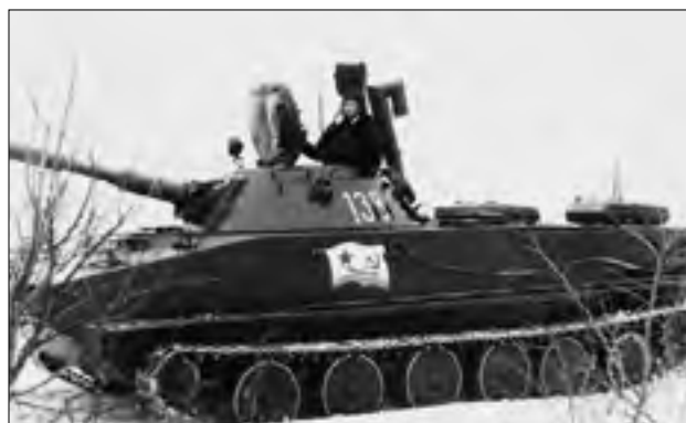
На тактическом учении батальона пт. 1967 г.