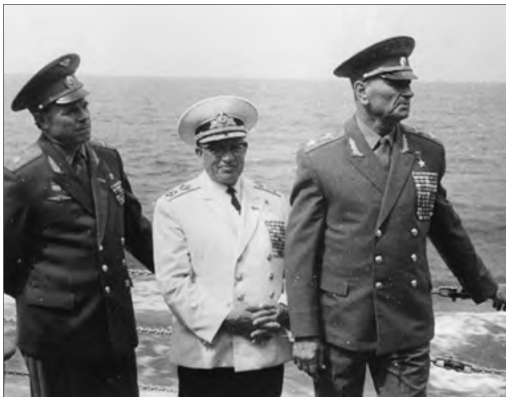
Министр обороны СССР А.А. Гречко, Главком ВМФ Советского Союза С.Г. Горшков, Главком ВВС П.С. Кутахов на учениях Пятой эскадры

И сразу навалились многочисленные проблемы. Командованию и штабу эскадры пришлось повседневно и даже ежечасно заниматься задачами и вопросами, требующими немедленного решения. Причем это касалось не только управления силами соединения (тем более при постоянной напряжен-