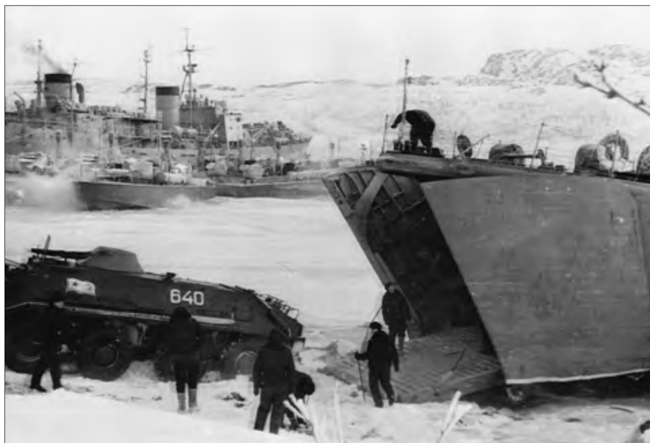
Посадка БТР-60ПБ на СДК. Лиинахамари. 1970 г.

говых войск ВМФ, у которых была красная окантовка погон.