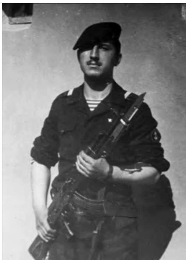
В. Головин. Спутник. 1971 г.

он профессионально пристрелял все пулеметы, но еще и отладил запасные стволы. Даже после его увольнения в запас мы долго не испытывали сложности в стрельбе из этих пулеметов. Я много раз добрым словом вспоминал этого морского пехотинца, благодаря которому был положен не один десяток мишеней.