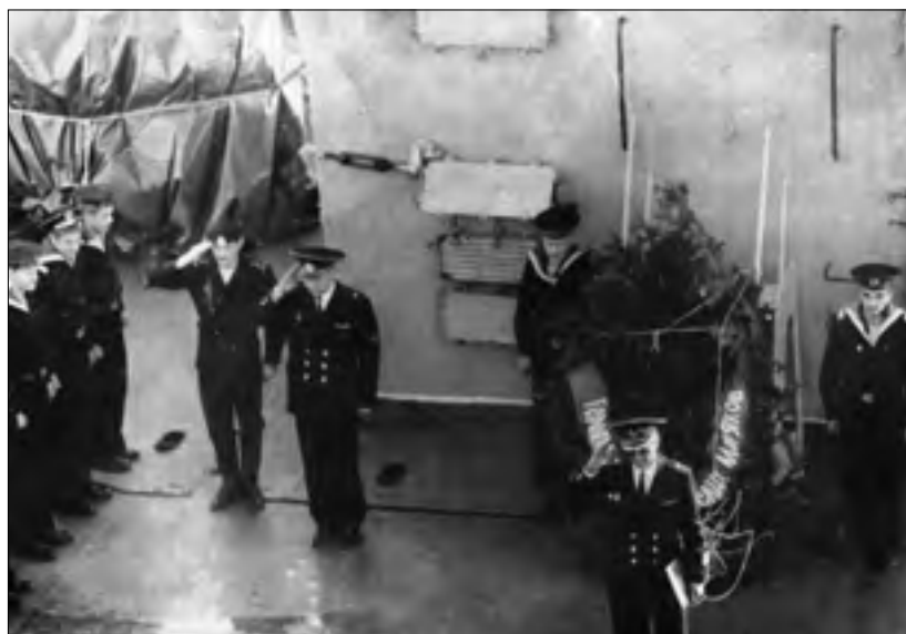
Корабль проходит Цусимский пролив