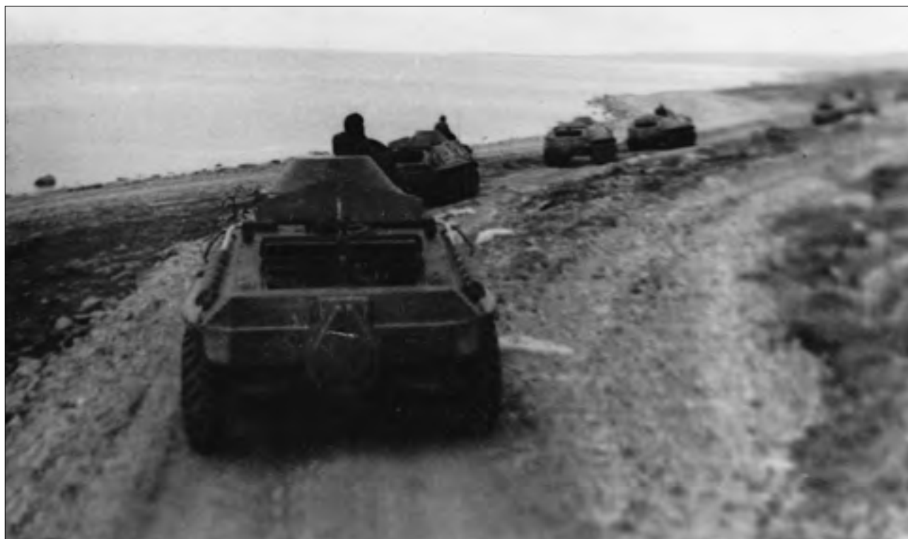
На марше. Полуостров Рыбачий. 1971 г.

данных местах и всего на несколько секунд. Тогда стали стрелять с помощью фосфорных (светящихся) насадок (одна на мушке, другая на планке прицела). Такой способ стрельбы ночью применялся во время Великой Отечественной войны. Мы потом так поднаторели в стрельбе с насадками, что НСП применяли только в открытом поле либо при снайперской стрельбе.