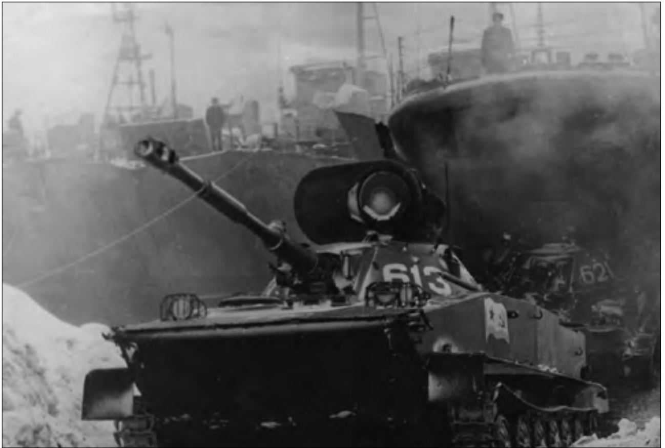
Высадка ПТ-76 из СДК. Лиинахамари. 1970 г.

В ноябре 1970 года, когда мы вернулись в Спутник, я с приятелем — таким же новоявленным младшим сержантом — направились по какой-то надобности в штаб. По дороге навстречу нам шел прапорщик. Как положено по Уставу, за пять-шесть шагов перед встречей с ним мы перешли на строевой шаг и, поравнявшись — приветствовали его. Наверное, его это удивило. Он подозвал нас к себе. При подходе к нему мы снова перешли на строевой шаг и, прижав руки к головным уборам, громко представились. Узнав, кто мы такие, попросил нас быть скромнее, объяснив, что в полку так приветствовать старших по званию не принято. Мы так и сделали. Тем не менее у меня постоянно ощущался дискомфорт при встрече с прапорщиками и офицерами, когда я приветствовал их без строевого шага.