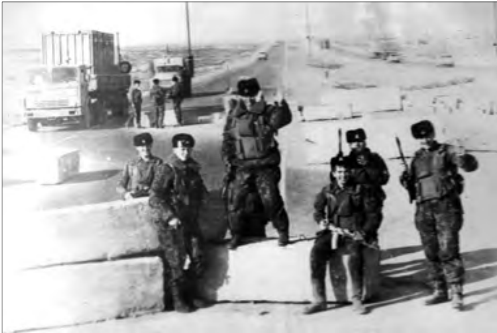
Баку-90. Февраль. 67 км