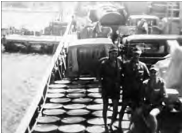
Военный порт Аден