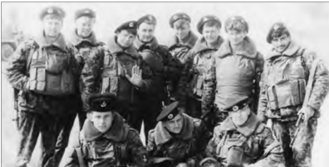
Разведвзвод 882 обмп на заставе