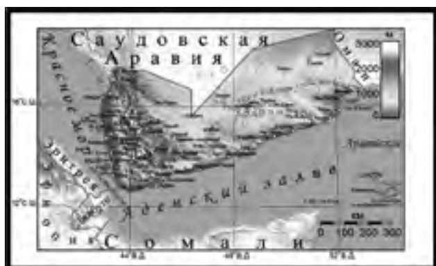
Схема Йеменского побережья и Аденского залива