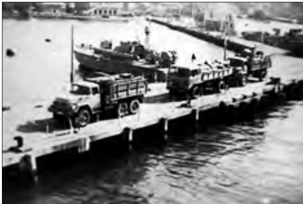
Военный пирс в порту Аден, загрузка БДК йеменским имуществом