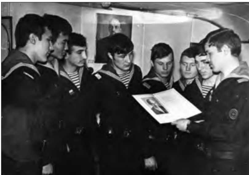
Почетная Ленинская грамота у экипажа корабля

В марте-апреле 1976 года совершал перевозки на Камчатку (Владивосток — Усть-Камчатский — Владивосток). В мае-июне 1977 года переходы по маршруту Владивосток — Курильские острова — Корсаков — Владивосток. В сентябре — Владивосток — б. Владимир — Владивосток. В октябре принимал участие в учениях