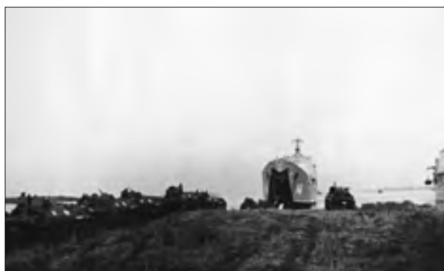
Погрузка десанта на корабли