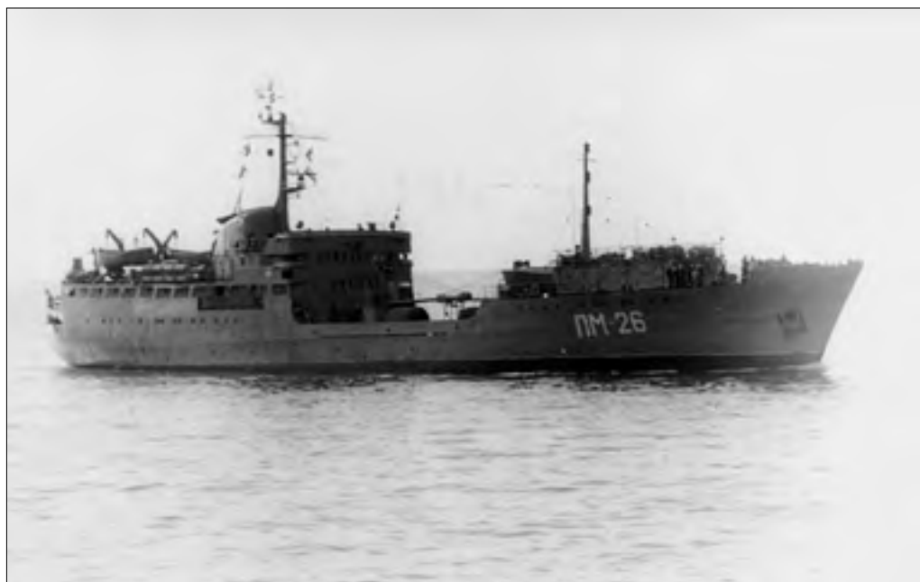
Плавмастер- ская ПМ-26

процесс продолжался уже в ходе отработки организации управления силами соединения. На якорной стоянке у острова Китира (точка № 5) все перешли на плавмастерскую «ПМ-26» и проследовали в Александрию.