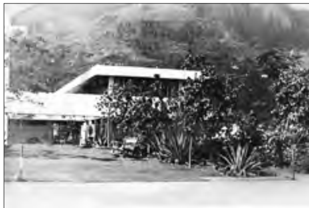
Дворец Независимости. Виктория. Сейшелы. 1977 г.

футбольные и волейбольные матчи между нашими моряками и местной полицией, увольнение личного состава в город.