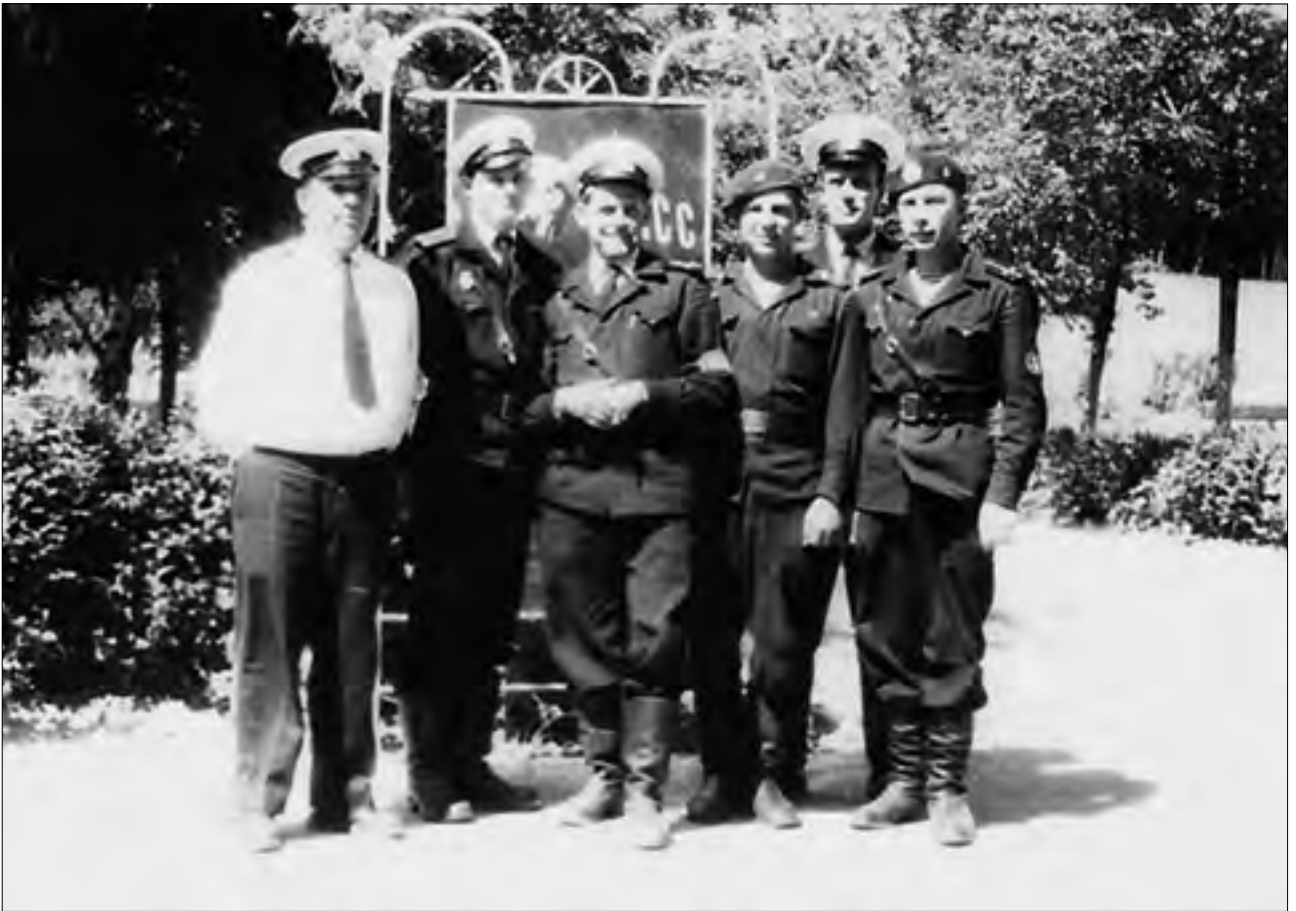
Офицеры и матросы батальона плавающих танков, п. Мечникова

Многие офицеры-танкисты, служившие в 55 дивизии морской пехоты, внесли достойный вклад в создание, развитие и боевое применение танковых подразделений и частей морской пехоты. Об этом наглядно говорят те сроки, в течение которых им пришлось командовать 150 танковым полком 55 димп КТОФ.