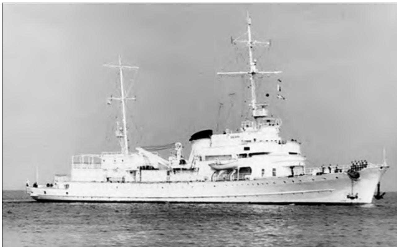
Штабной корабль Пятой эскадры «Ангара»

С.Г. Горшков еще до «шестидневной войны» определил, что командиром эскадры, его заме-